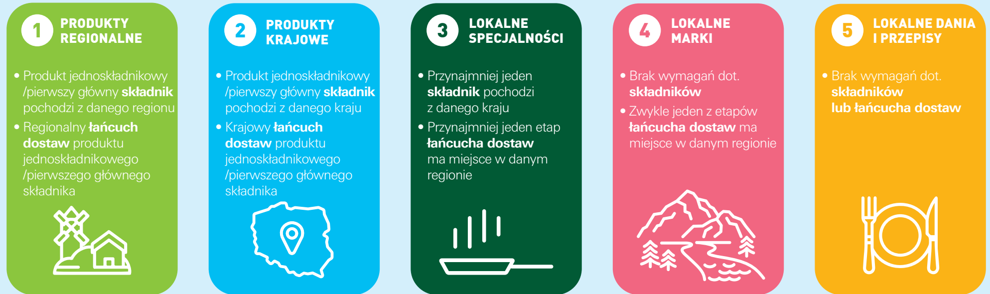
Ryc. 1. Pięcikolumnowy model lokalnych produktów spożywczych ALDI Nord: Informacje ogólne

Z punktu widzenia zrównoważonego rozwoju ALDI Nord preferuje produkty regionalne i krajowe (kolumny: 1. i 2.) względem lokalnych specjalności i marek (kolumny: 3. i 4.), ponieważ te pierwsze w sposób bardziej całościowy przyczyniają się do wzrostu konsumpcji przyjaznej dla środowiska. Dlatego też skupiamy się na sprzedaży produktów regionalnych i krajowych. W przypadku krajów o ograniczonej ofercie produktów regionalnych nacisk kładziemy na produkty krajowe, a w następnej kolejności na lokalne specjalności i marki.